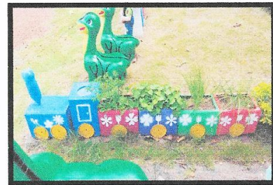
ผักสวนครัวเจริญเติบโต