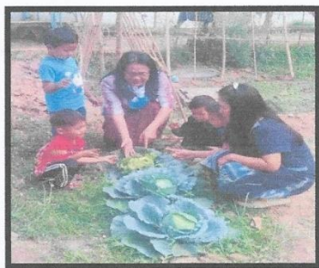
เด็กเรียนรู้การเจริญเติบโตของผักสวนครัว