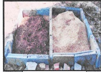
ภาพบ่อปุ๋ยหมัก