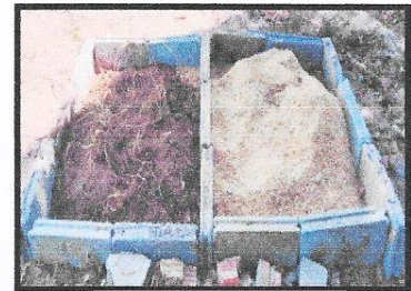
ภาพบ่อปุ๋ยหมัก