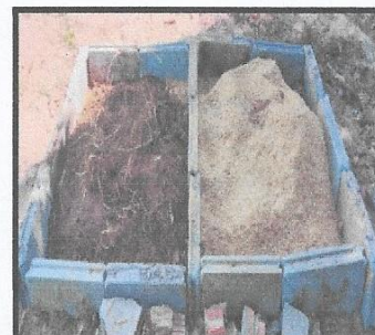
ภาพบ่อปุ๋ยหมัก