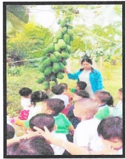
เด็กเรียนรู้การเจริญเติบโตของผักสวนครัว