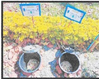
ภาพบ่อขยะเปียก