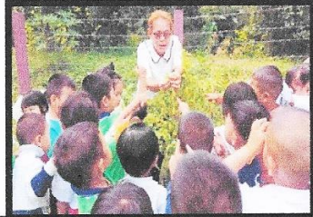
ภาพเด็กทำกิจกรรมในสวนครัว