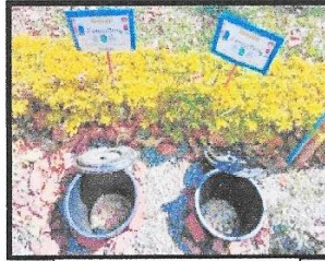
ภาพบ่อขยะเปียก