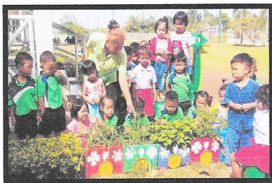
เด็กเรียนรู้การเจริญเติบโตของผักสวนครัว