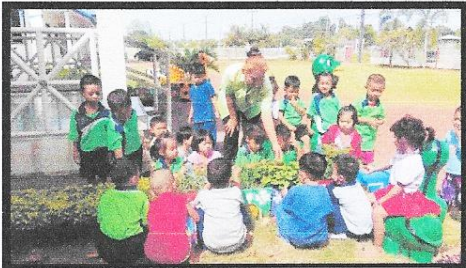
ภาพเด็กทำกิจกรรมในสวนครัว