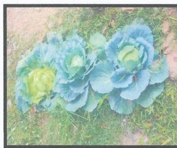
ผักสวนครัวเจริญเติบโต