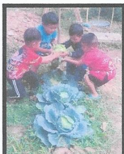
ภาพเด็กทำกิจกรรมในสวนครัว