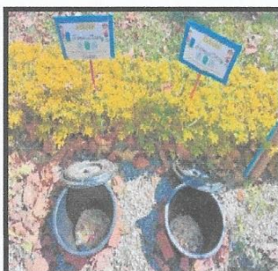
ภาพบ่อขยะเปียก