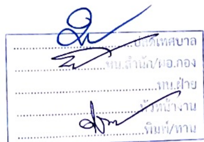
(นายรวิโรจน์ สองทุ่ง) นายกเทศมนตรีตำบลบ้านเตือ

ประกาศ ณ วันที่ ๕ เดือน เมษายน พ.ศ. ๒๕๖๕